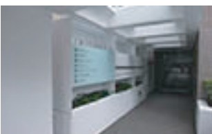
田町ビジネスセンター