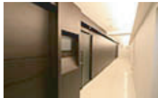
新宿ビジネスセンター