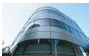
永田町ビジネスセンター