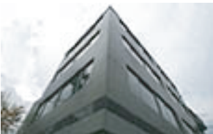
西新宿ビジネスセンター

3年スライド料金の家賃割引は以下のオフィスで実施しています。(詳細は、各物件のページを参照)