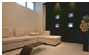
神田ビジネスセンター