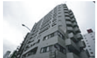
品川ビジネスセンター