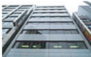
渋谷ビジネスセンター