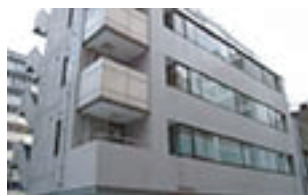
日本橋ビジネスセンター