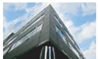
日本橋第二ビジネスセンター